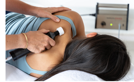
◀ Nackenbehandlung ▼ Schulterbehandlung

Mit dem Medizinprodukt Matrixmobil® behandelt der Therapeut Verhärtungen und Verkürzungen im Gewebe. Wenn die Muskelzellen durch die Behandlung sanft eingeladen werden, wieder mit zu pulsieren, kann sich die Zell-Logistik optimieren. Der lymphatisch-venöse Abfluss macht so frischen Metaboliten sowie Sauerstoff die Bahn frei. Die Heilungsprozesse des Körpers sind nicht mehr blockiert.