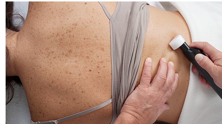
▲ Rückenbehandlung ▶ Kniebehandlung